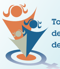
Table de concertation des groupes de femmes de Lanaudière

Graphisme : Maud Sammartano de l'Atelier graphique