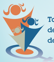
Table de concertation des groupes de femmes de Lanaudière