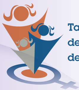
Table de concertation des groupes de femmes de Lanaudière

Rédaction : Francine Rivest en collaboration avec Amy Magowan Greene