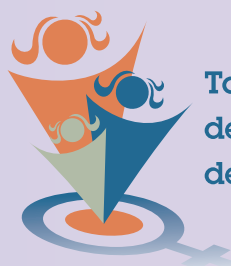
Table de concertation des groupes de femmes de Lanaudière